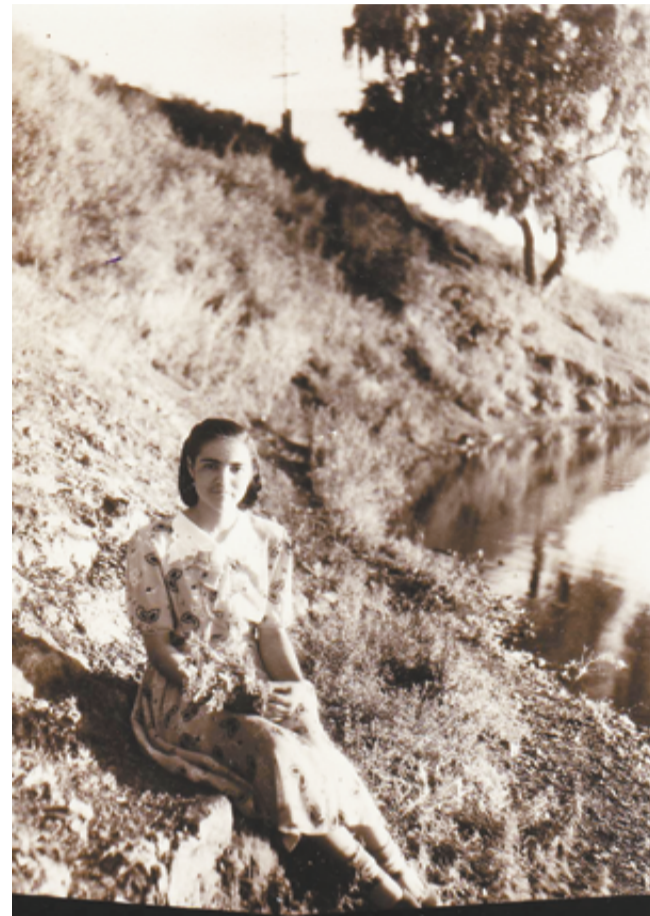
Одинокая берёзка на берегу реки в степной Варне стала основной достопримечательностью для молодёжи

Да, всё, что делается в нашем селе, делается для людей, то есть для нас с вами, живущих здесь. И наша задача — сохранить всё это достояние, а для этого нужно не материальное богатство, а душевное. Будет душа, будет хозяйское отношение ко всему, что нас окружает, тогда будет не