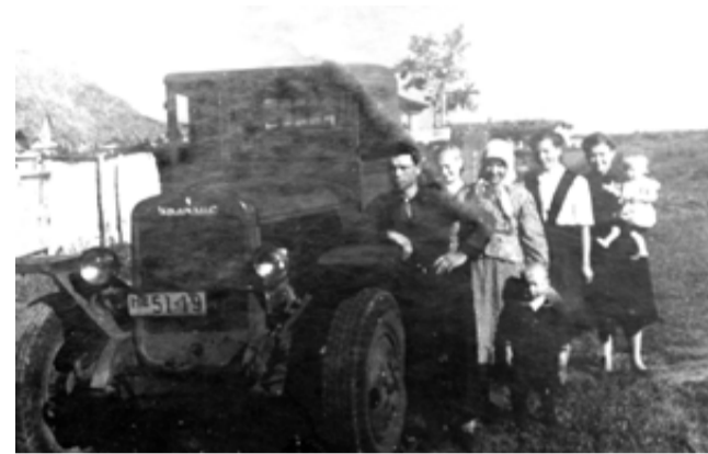
ЗИС—5 в простонародье «Захар» — труженик войны и тыла